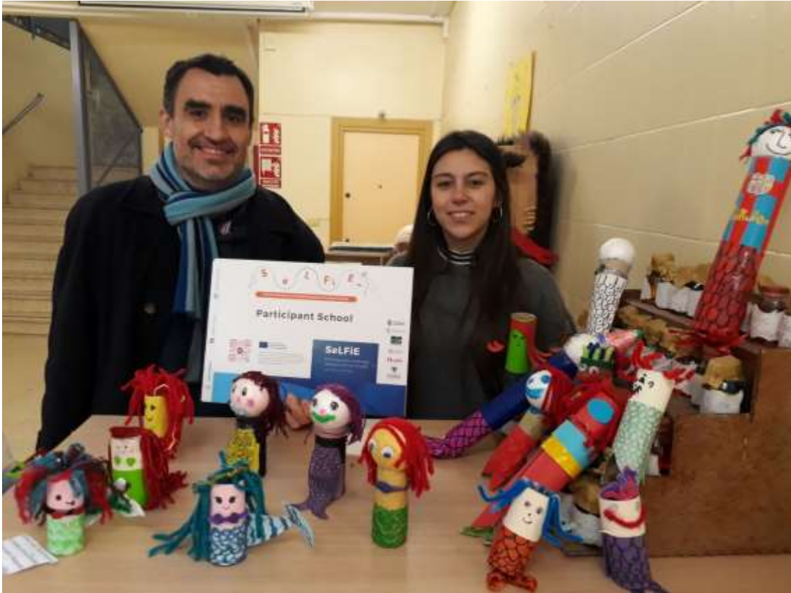
CEIP Jueces de Castilla (Burgos, Spain). Participants in the project SeLFiE showing students' creations based on Guardians of the Sea https://project-selfie.eu/wp-content/uploads/2022/05/CEIP-Jueces-de-Castilla-Burgos-scaled.jpg